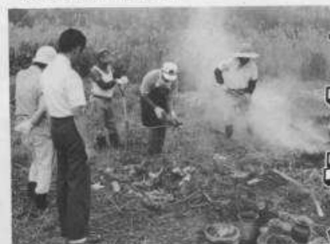
▲野焼きによる土器の仕上げ

記念式典をはじめ、茶会やハーモニカクラブ、舞踊団の演芸等各種イベントを行ない、600人程の人数でにぎわった。