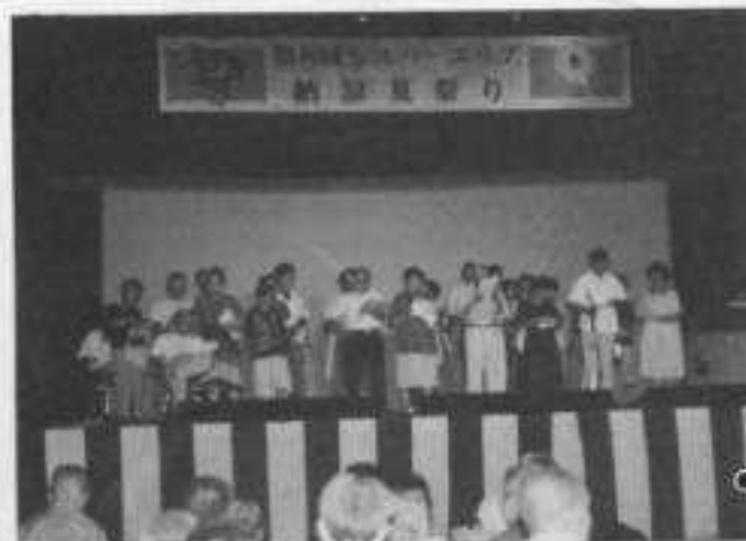
▲第8回納涼夏祭り—8月4日(土)—

エリア利用者や職員による余興、妻人の方による民謡や盆おどりが行なわれ、1,700人程の人が夏の夜を心ゆくまで楽しんだ。