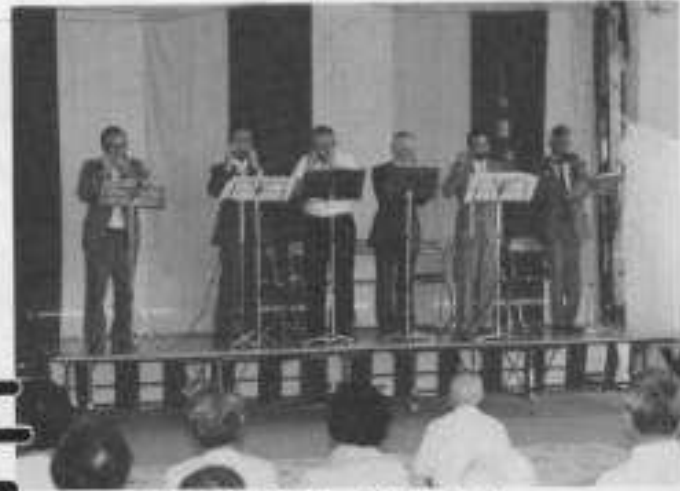
▲第2回エリア祭—7月1日(土)—

エリア利用者や職員による余興、妻人の方による民謡や盆おどりが行なわれ、1,700人程の人が夏の夜を心ゆくまで楽しんだ。