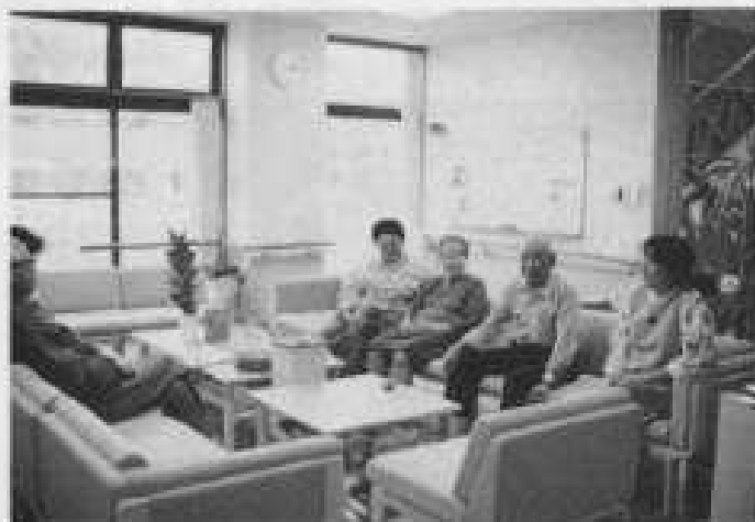
▲ラウンジでの憩いのひととき