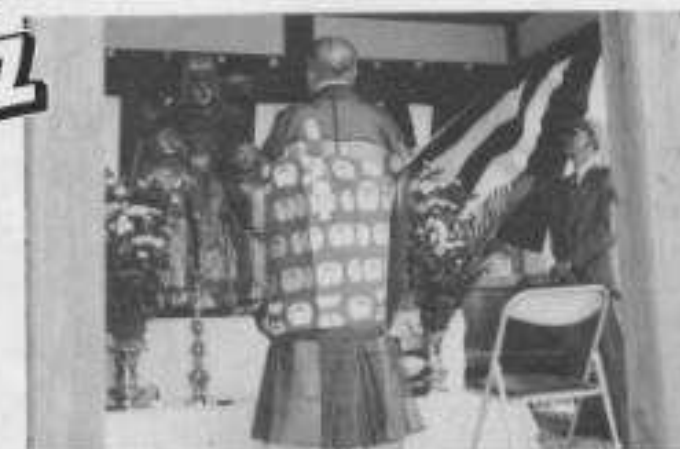
▲白衣観音菩薩入仏法要

報道取材があいついでいます。例をあげると、「テレビ朝日—ごんには2時」「フジテレビ—すこやかさん」「テレビ神奈川—遊々開レポート」etc.新聞、雑誌では「朝日新聞(全国版)」「AERA(アエラ)」「家の光」など多数。入居者、職員ともメヅのポーズがうまくなったようあり