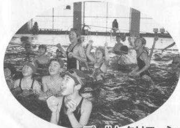
プールレクリエーション