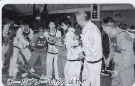
チームプレーでがんばれ!!

我がエリアからは二十一名が参加、日頃の練習の成果を十分に発揮し、六種目あった競技の中で特に成績の良かったのが「ボール送り競争」、職員と利用者の息のあったコンビネーションで二位と大健闘、みんな大喜びでした。応援合戦では「河内男節」を披露、力強いパフォーマンスを見せていました。総合成績は、健闘むなしく五位。来年こそは、この位置(最下位)から脱出するぞーそして狙うは……。