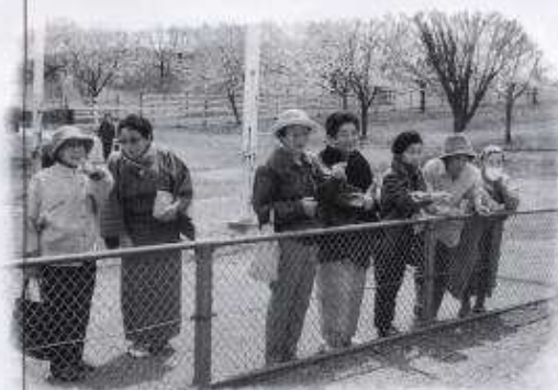
あや〜、めんげごと(でも何がいるのかな?)