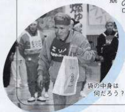
袋の中身は何だろう?