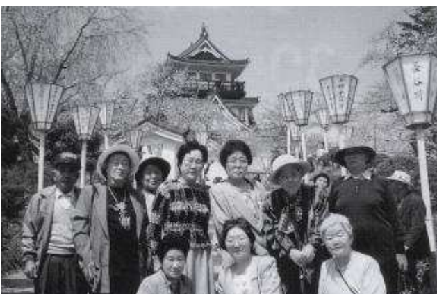
シルバーケアのお姫様勢揃い!