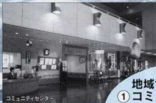
コミュニティセンター