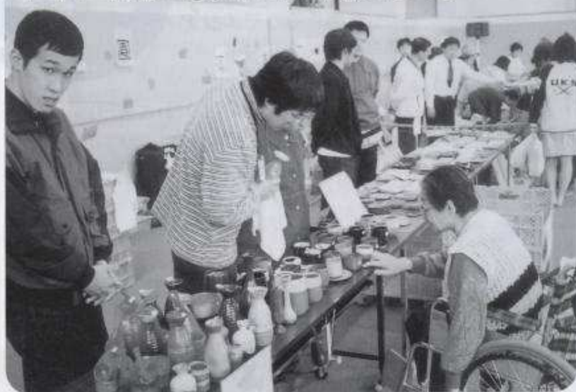
活き活き学園で製作・練習・稽古の発表の場です。