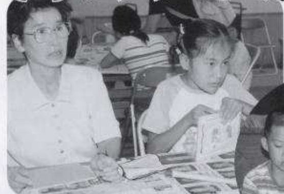
親子で陶芸・料理・木工などの 創作教室に楽しく参加