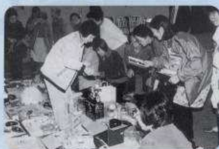
盛況だったフリーマーケット

大森太鼓は、一変して激しいばちさばち、小学生から中学生までが力強い演奏を披露してくれました。また展示即売会は大盛況で、野菜や縫製品、陶芸、木工製品、フリーマーケットなど、また季節がらりんごや柿などの果物を買求めるお客さんでごった返していました。