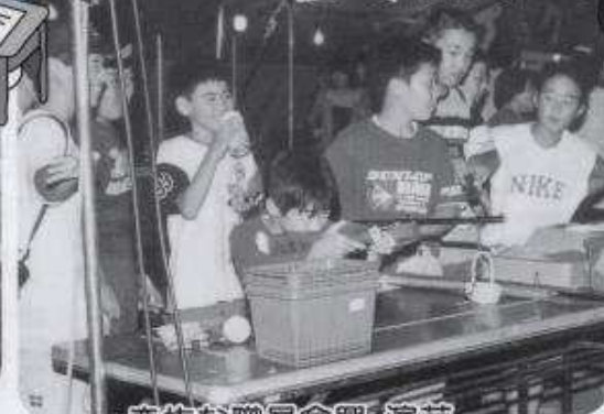
奇抜な職員余興、演芸、 おいしい屋台がたくさんです。