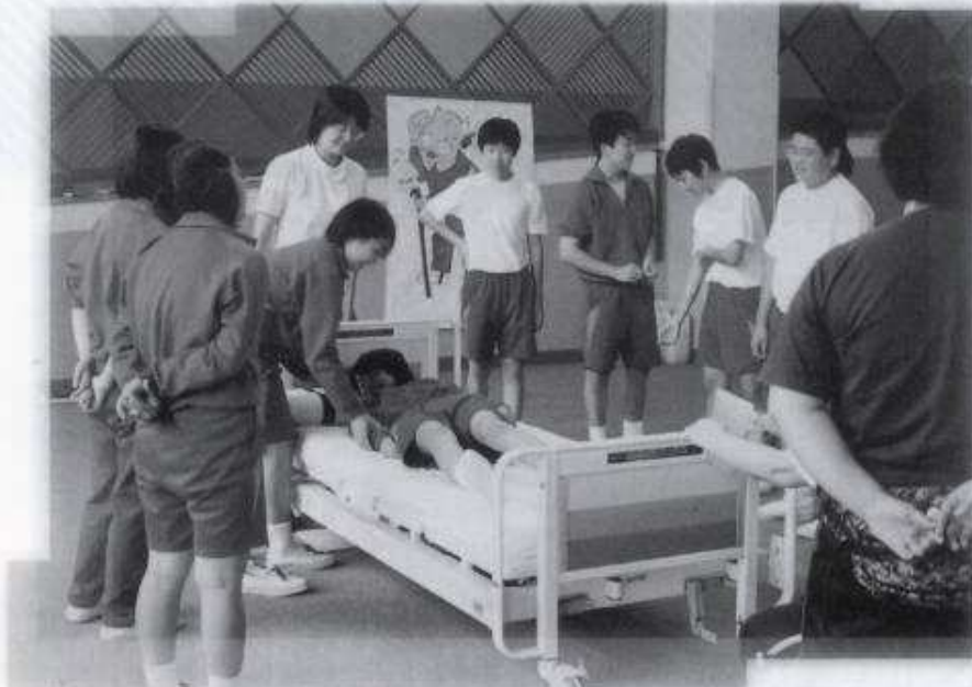
釜ヶ台中学校(仁賀保町)福祉講座