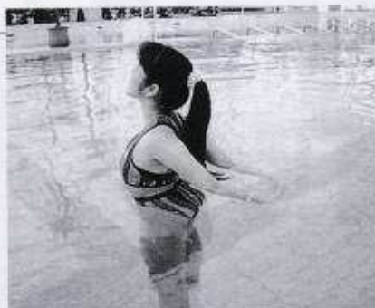
① 胸 (大胸筋)

両足を肩幅より開いて立ち、左腕を伸ばしたまま水面に浮かせて右側に寄せます。右腕で前腕部を固定し、胸に引き寄せます。肩まで水に浸けて行います。(左右10秒間)