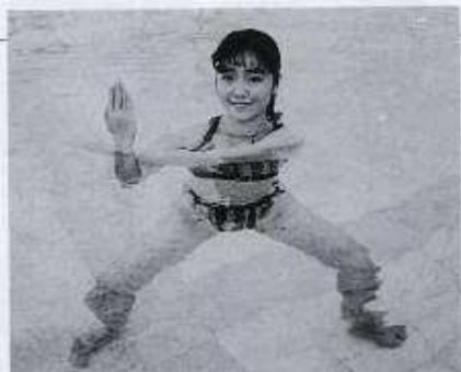
② 腕と肩 (三角筋 上腕三頭筋)

両足を肩幅より開いて立ち、左腕を伸ばしたまま水面に浮かせて右側に寄せます。右腕で前腕部を固定し、胸に引き寄せます。肩まで水に浸けて行います。(左右10秒間)