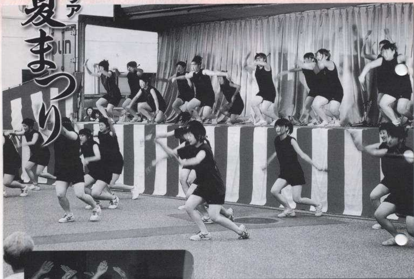
横手城南高校 YOSAKOIソーラン節愛好会のみなさん