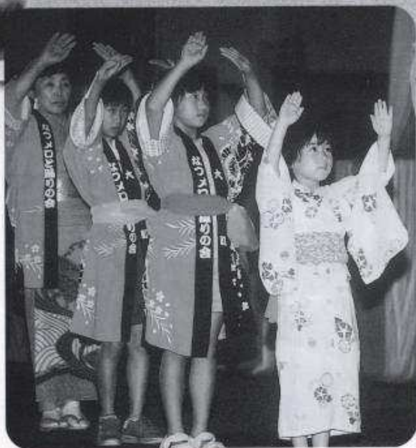
なつメロの会・地域の皆さんによる大森音頭