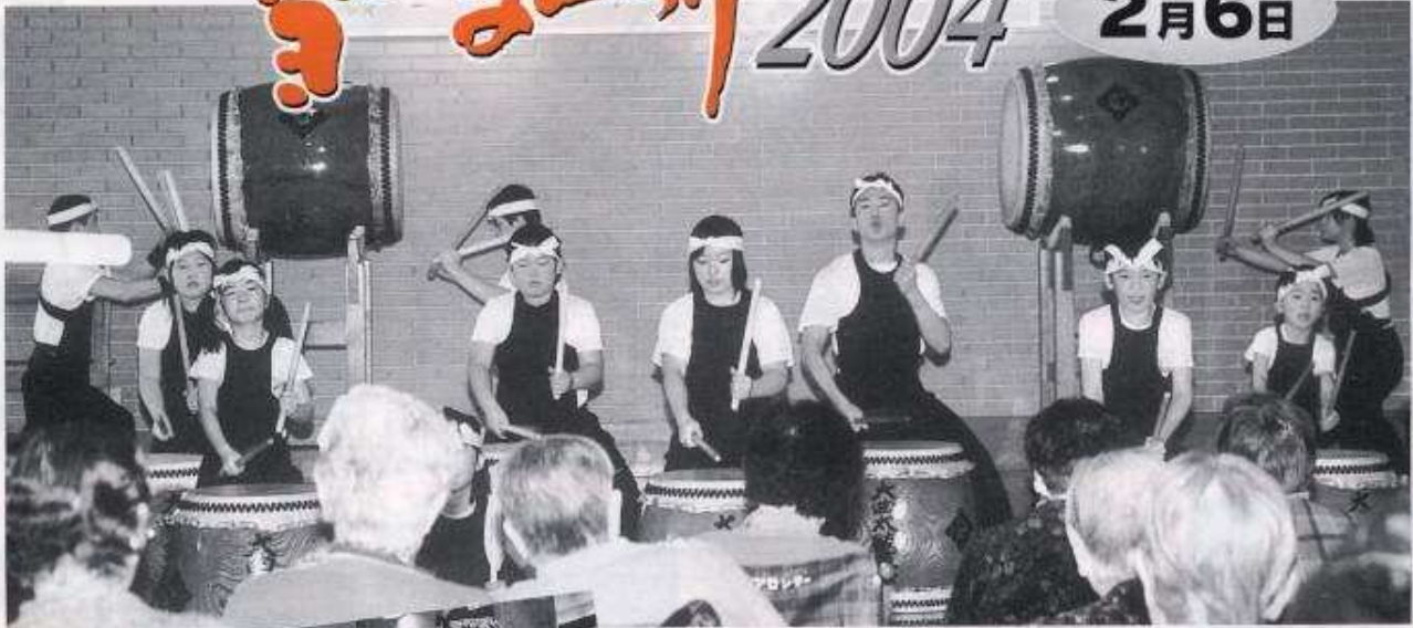
大曲太鼓道場の皆さん