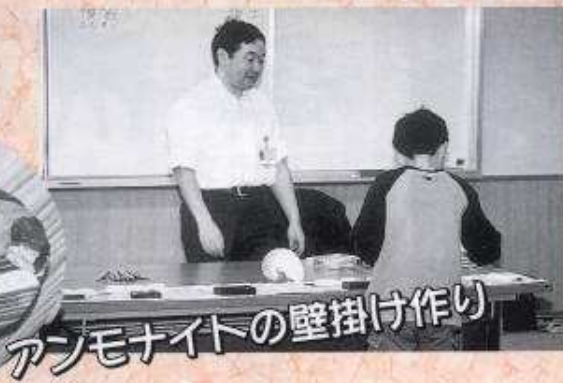
アンモナイトの壁掛け作り