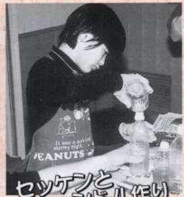
セッケンとキャンドル作り