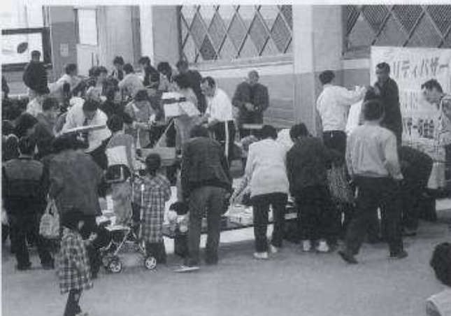
チャリティーバザー