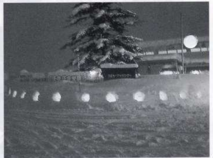
—夕暮れに灯る蠟燭の火—