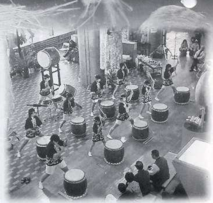
大森太鼓愛好会の皆さん