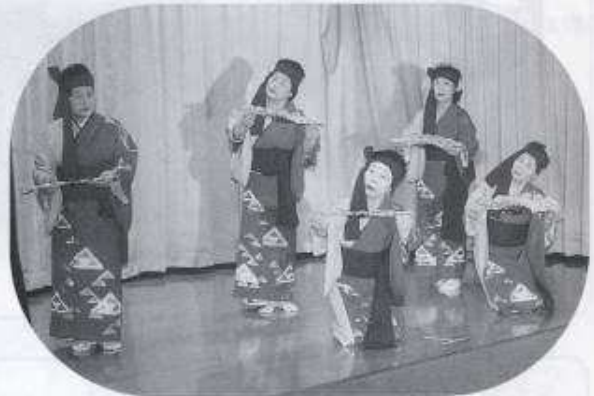
踊りの会教室の皆さん