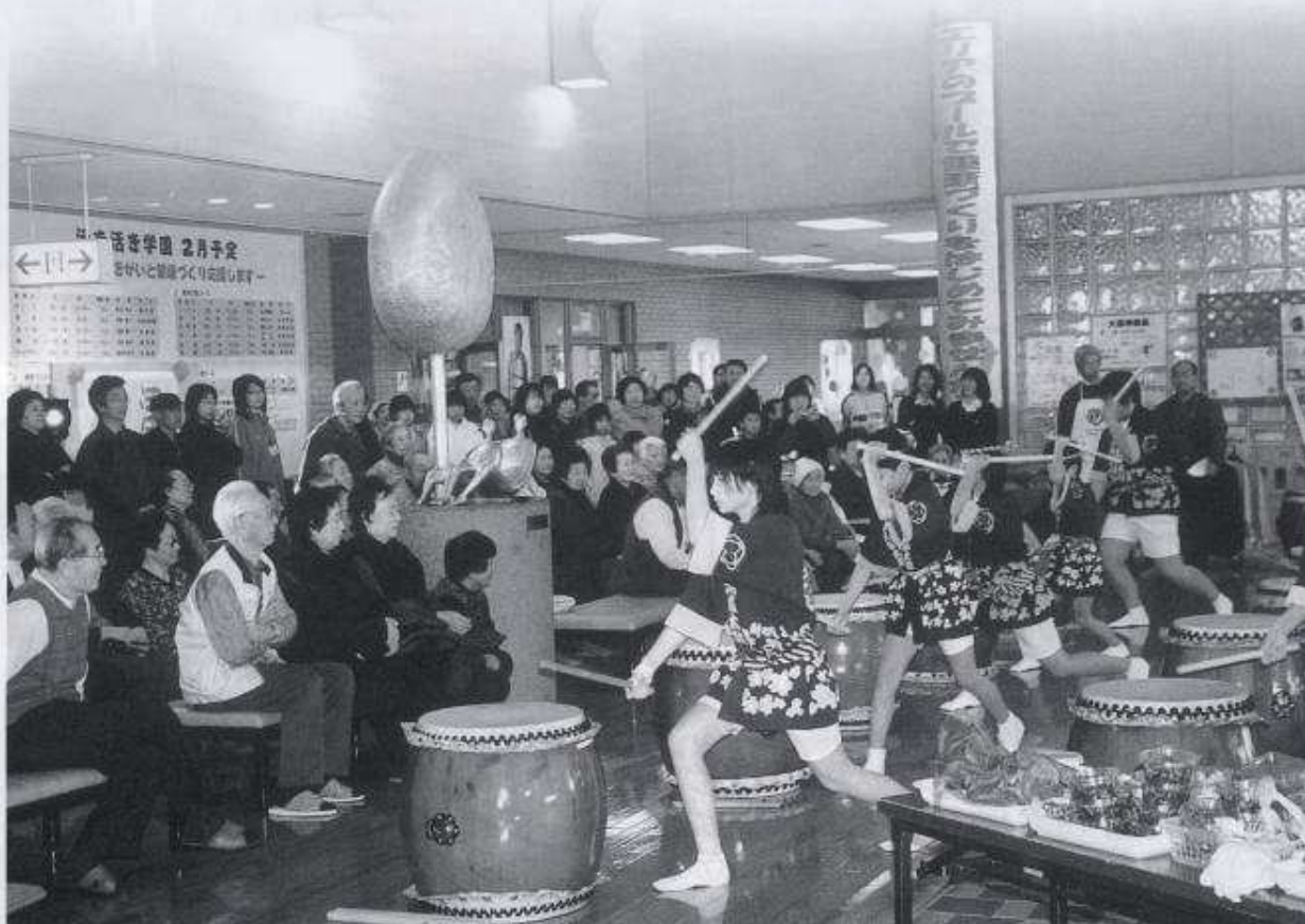
—大森太鼓愛好会の皆さん—

午後からは屋内運動広場を会場にスポーツチャンバラエリア大会が行われ、多くの子どもたちが元気に参加し盛り上がった大会になりました。