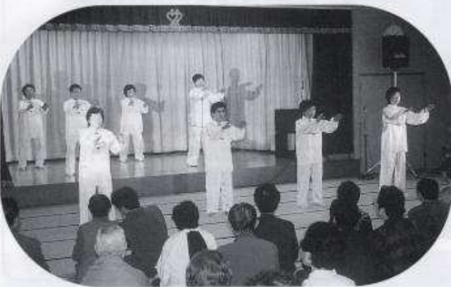
太極拳教室の皆さん