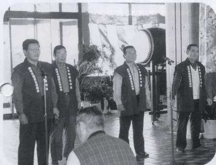
基句を披露 —秋田相撲甚句会の皆さん—

オープニングの大森太鼓演奏で今年の雪まつりが始まりました。コミセンホールに大小の太鼓がセットされそろいので立ちの大森太鼓愛好会の皆さんによる迫力ある演奏がエリア中に響き渡りました。また、秋田相撲甚句会の皆さんの相撲甚句の披露がありました。