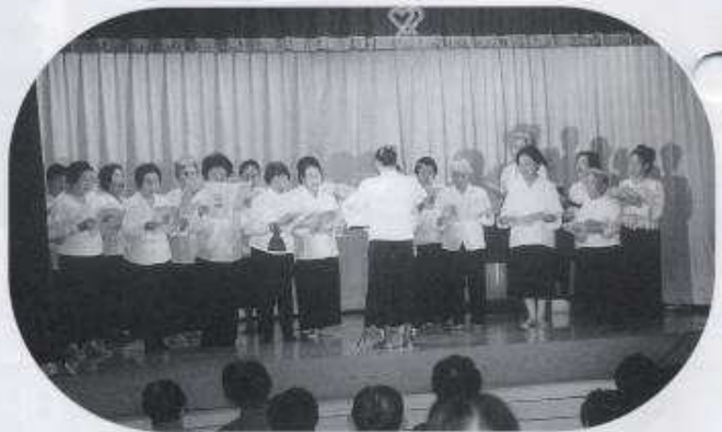
コーラス教室の皆さん