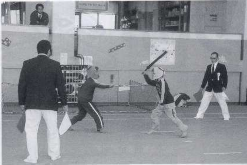
—スポーツチャンバラ大会—