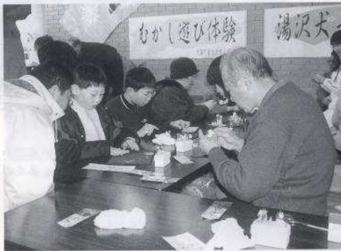
新粉細工 —湯沢いぬっこづくり—