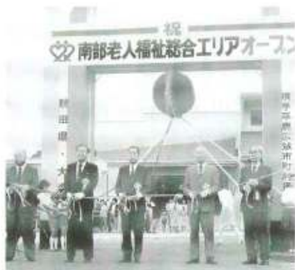
昭和63年7月1日オープン