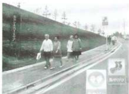
県内で初めての “思いやりゾーン”