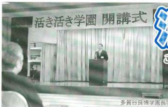
活き活き学園 開講式