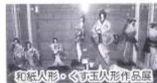
和紙人形・くす玉人形作品展