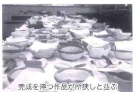
完成を待つ作品が所狭しと並ぶ

「お子さんや初めて体験される方が大半ですので、扱いやすいようにあらかじめこねて伸ばしたり、興味を持って、手に取ってもらえるような題材を考えています。また、制作した物が上手く完成するように窯焼きでは