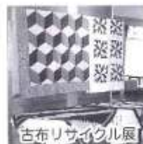
古布リサイクル展

エリア・ラウンジの展示スペース(ミニミニギャラリー)では毎月作品展を開催中。皆様のお気に入り、こだわりの作品をご紹介ください。展示していただける方はぜひお気軽にお問い合わせください。