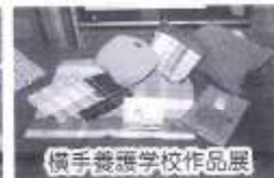
横手養護学校作品展