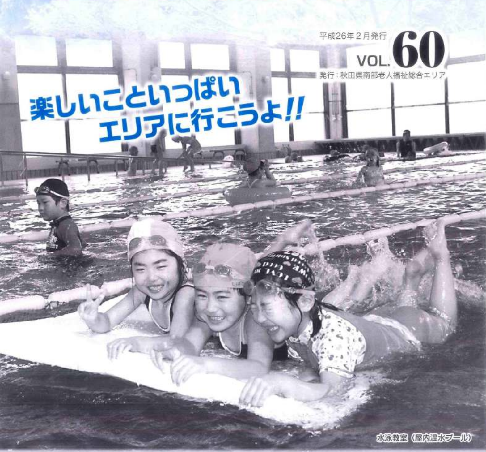
水泳教室（屋内温水プール）