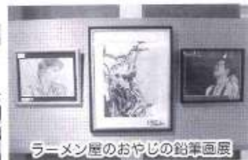
ラーメン屋のおやじの鉛筆画展