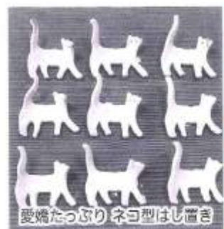
愛猫たっぷりネコ型はし置き

「電動ろくろは熟練していないので曲がってしまう事があります。自分の感覚、体を大切にしています。が、気持ちに余裕がな