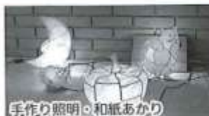
手作り照明・和紙あかり