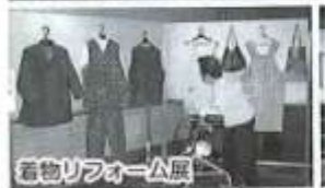
衣飾リフォーム展