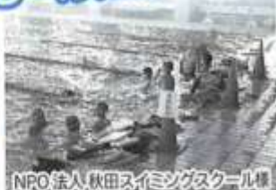
NPO法人 秋田スイミングスクール様

25mコースが5コースのプールです。水深は約1m、季節や天候を問わずいつでも快適にご利用いただけます。ラウンジを含め無料Wi-Fiサービスをご利用可能です。スポーツタイマー等プール用品の貸し出しあり。屋内運動広場を利用しての筋力トレーニングやストレッチ等の組み合わせも自由。プールコースレイアウトの変更やバス送迎等についても対応可能。