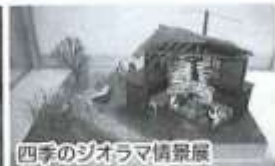
四季のジオラマ情景展