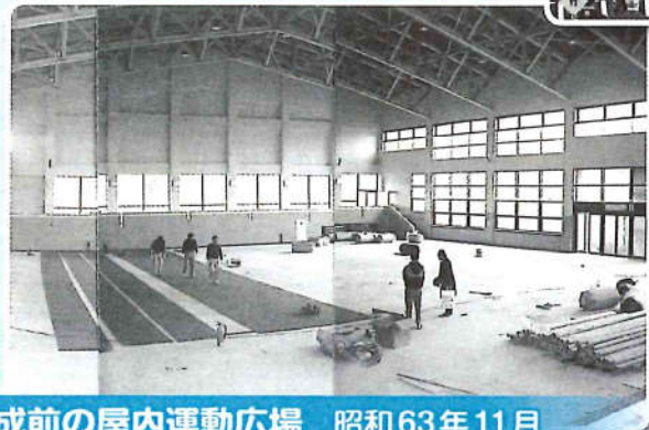
完成前の屋内運動広場 昭和63年11月