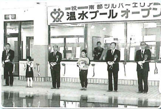
温水プールオープン 平成元年12月1日