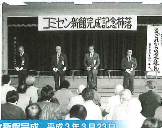
コミセン新館完成 平成3年3月23日