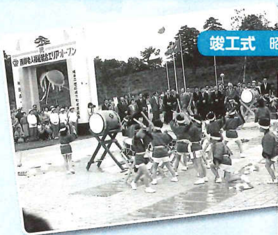
竣工式 昭和63年7月1日