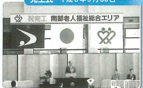
完工式 平成3年9月30日