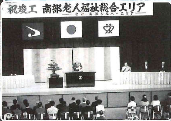
祝竣工 南部老人福祉総合エリア