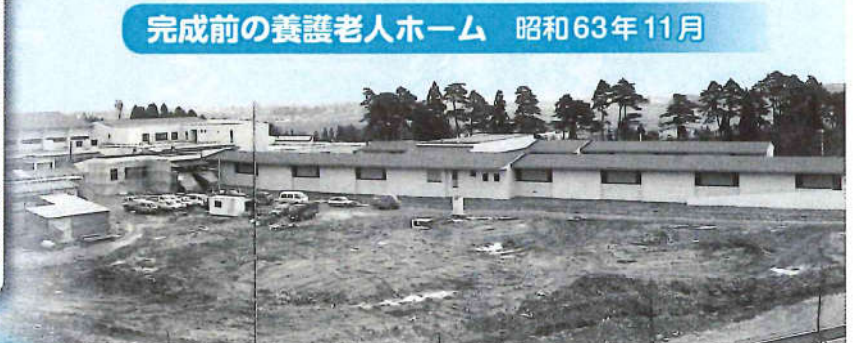
完成前の養護老人ホーム 昭和63年11月