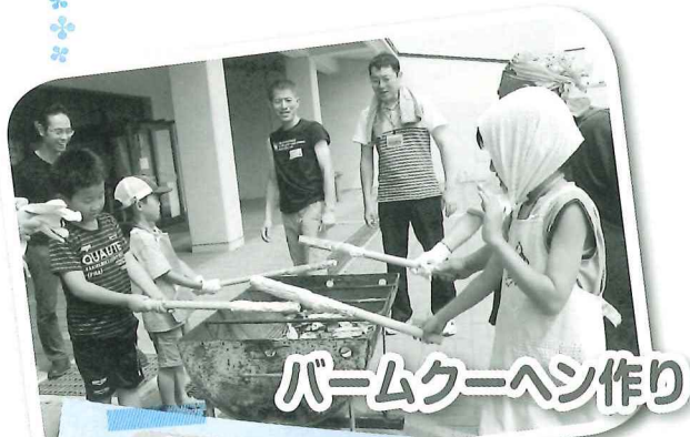
バームクーヘン作り

毎年人気殺到の親子創作活動「チャレンジ教室」を開催しました。今年も夏冬合わせて県南の小学校56校から親子で532名の参加がありました。(参加者の感想を掲載しました)それぞれの教室に参加し、たくさんのちびっこ職人が誕生！ 今回の参加もお待ちしております。