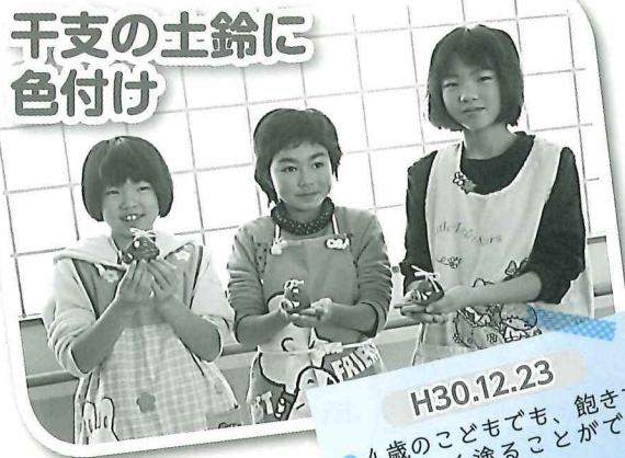
干支の土鈴に色付け