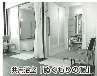
共用浴室「ぬくもりの湯」

その他、入居希望等、随時ご相談を受け付けておりますので、お気軽にお問合せください。