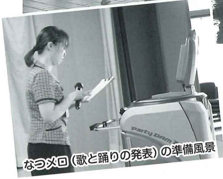
なつめ回 (歌と踊りの発表) の準備風景

コミュニティセンターでの仕事は、皆様をお迎えするだけではなく、団体の客の受け入れや宿泊の準備、さらにはプールの受付・各種教室・イベント・大会などの企画運営と多岐に渡ります。