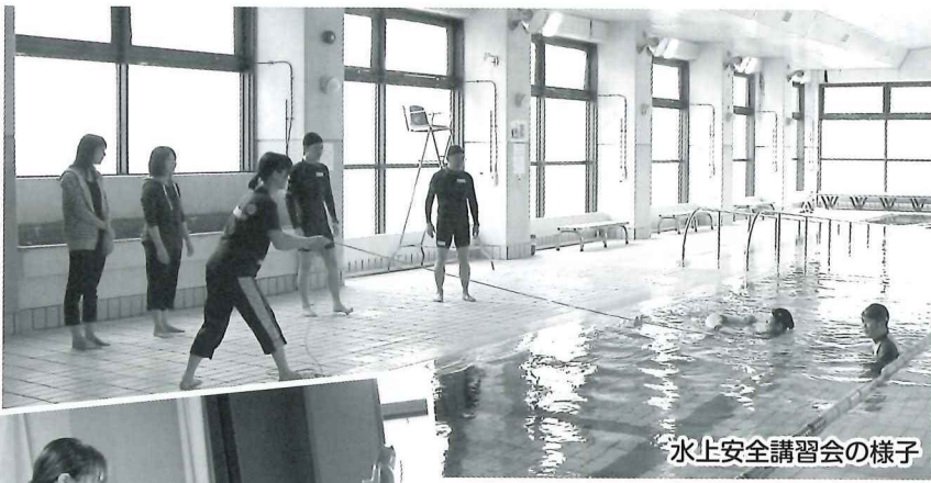
水上安全講習会の様子