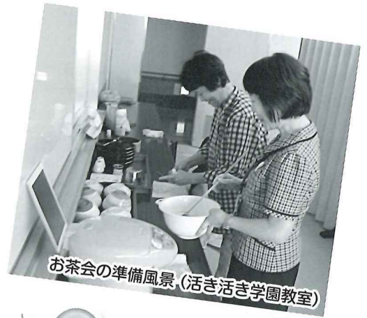
お茶会の準備風景 (生き生き学園教室)